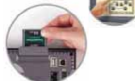
CF Hafıza Kartı Kurulumu