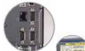
Seri ve Ethernet Portları

Windows XP/CE ve WinXPe, NEMA4 / IP65, USB 2.0, RS-232,RS-485, RC45, VGA,Paralel Port