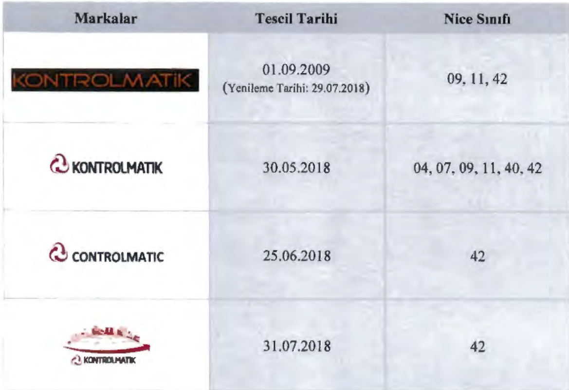
Tablo 8: Şirket adına tescil edilmiş markalar

Şirket tarafından sağlanan Türk Patent ve Marka Kurumu'nun "2008 44706 – Ticaret - Hizmet", "2018 12072 - Hizmet", "2018 12077 – Hizmet" ve "2018 12068 – Ticaret - Hizmet" numaralı Marka Tescil Belgeleri ve Türk Patent ve Marka Kurumu'nun elektronik kayıtları ( https://online.turkpatent.gov.tr/trademark-search/pub/trademark_search?lang=tr ) üzerinden gerçekleştirilen inceleme neticesinde, Şirket adına aşağıda belirtilen markaların tescil edilmiş olduğu ve koruma sürelerinin devam ettiği anlaşılmıştır.